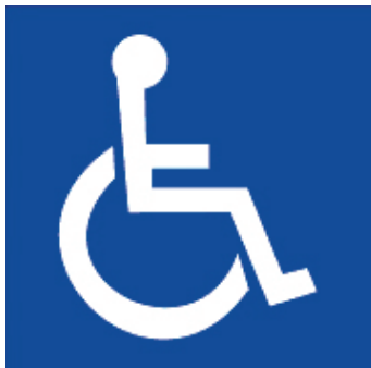
Medzinárodný symbol prístupnosti