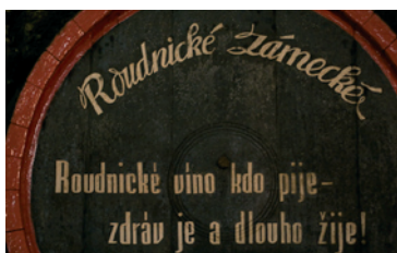
Roudnice Lobkowicz Winery