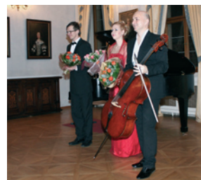
Soubor Maurice po představení v Lobkowiczském paláci