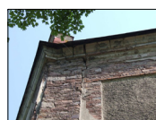
4- stav římsy a puklina