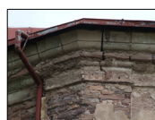
5- stav římsy