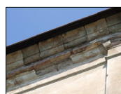
6- stav římsy