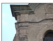
1- starý šlukovský výhled štítu