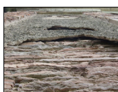
2- odupování omítek ve větších místy soudržných brách