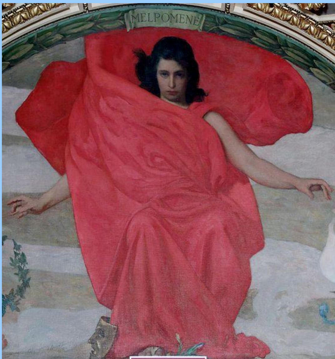
Melpomené múza tragédie

U.S. Library of Congress Edward Emerson Simmons (1852-1931) Foto: Carol Highsmith