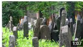
Old Jewish cemetery (Jewish Museum in Prague)

Jewish Museum in Prague (Židovské muzeum v Praze) 5 746 zhlédnutí • před 1 rokem