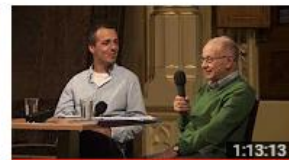
Naše 20. století - Útěk na Východ | Petr Arton

Jewish Museum in Prague (Židovské muzeum v Praze) 180 zhlédnutí • před 4 měsíci