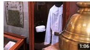
Klausen Synagogue (Jewish Museum in Prague)

Jewish Museum in Prague (Židovské muzeum v Praze) 881 zhlédnutí • před 1 rokem