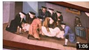
Ceremonial Hall (Jewish Museum in Prague)

Jewish Museum in Prague (Židovské muzeum v Praze) 5 746 zhlédnutí • před 1 rokem