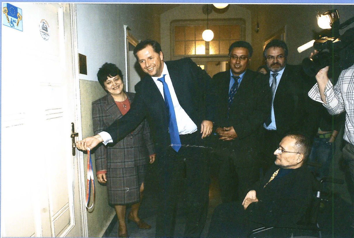
První otočení euroklíčem v budově Krajského úřadu Středočeského kraje